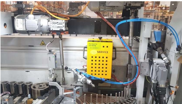
Biese – Verleimteil nach 10-monatigem Einsatz