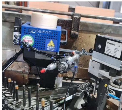
HOMAG Powerline, Bj- 2002 – nachgerüstet 2024