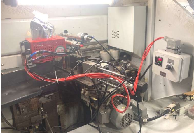
Brandt KDF540 2C Bj. 2007 – 2024 nachgerüstet