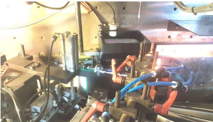
IMA mit offenem Vorschmelzer